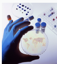
Undervisning og forskning

Sammenhængen medvirker til mere målrettede løsninger inden for det ergonomiske og fysiske arbejds miljø, hvilket giver sig udslag i målbare parametre som nedsat sygefravær, forkortelse af sygefraværperioder ved bevægeapparatsrelaterede problemstillinger og fastholdelse af medarbejdere.