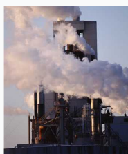
Industri, transport og handel